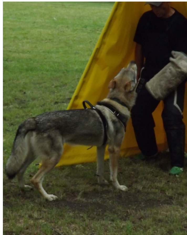
Cair Potomok vlkov