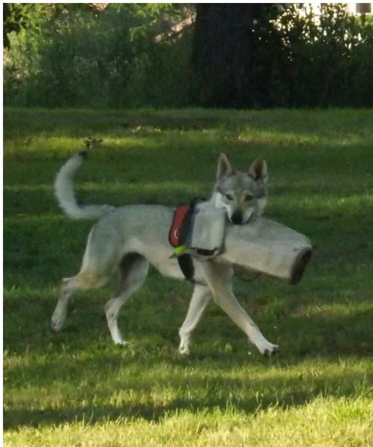
Zdenička z Litavské kotliny